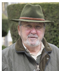
S. ITURMENDI PRESIDENTE ONC

“El reto del animalismo es enorme. Es un gran ogro que amenaza la caza, uno de los grandes problemas a los que nos enfrentamos. Es necesario desarrollar un argumentario para contrarrestar esa doctrina animalista”.