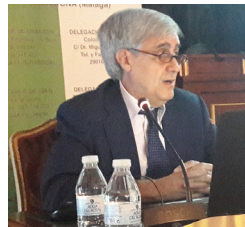
JUAN JOSÉ BADIOLA PRESIDENTE DEL CONSEJO GENERAL DEL COLEGIO DE VETERINARIOS

“Estamos a favor del bienestar animal aplicado de forma razonable y basado en estudios científicos serios y rigurosos, pero no cuando se plantee desde la demagogia y el desconocimiento”.