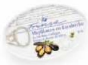
Mejillones en escabeche de las Rías Gallegas fritos en Aceite de Oliva