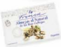
Almejas al Natural de las Rías Gallegas