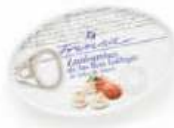
Zamburiñas de las Rías Gallegas en Salsa de Vieira