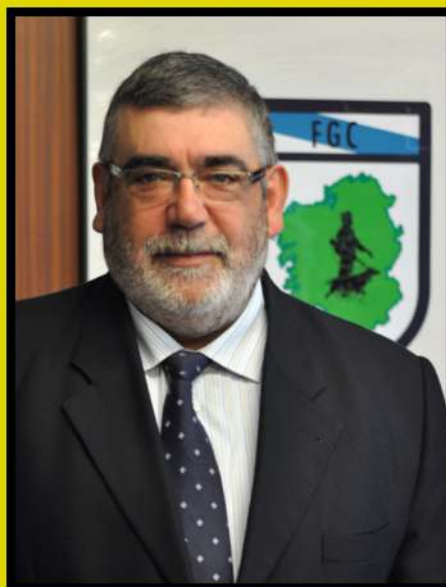
Javier Nogueira Diz Presidente de la Federación Galega de Caza

Dicen que tarde o temprano, las aguas siempre vuelven a su cauce. En este caso, al cauce de Río Sar, la sociedad cuyas excelentes instalaciones volverán a albergar una vez más el Campeonato de España de Recorridos de Caza.