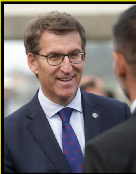
Alberto Núñez Feijoo Presidente de la Xunta de Galicia

Los gallegos tenemos la suerte de gozar de una naturaleza de privilegio, un paisaje verde y frondoso que nos define y caracteriza. Este don que se nos ha dado es necesario aprovecharlo al máximo, y por eso me parece que la 43 edición del Campeonato de España de Recorridos de Caza es una cita que no debemos perdernos.